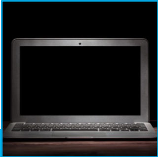
PC's | Laptop | Macs | Tablets