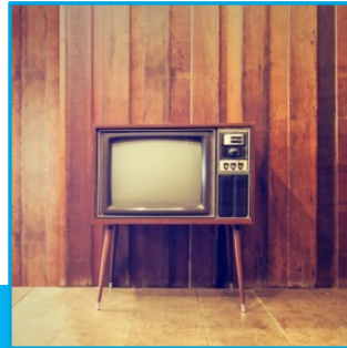
LCD's | Televisions