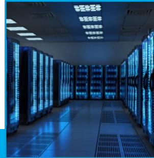
Servers | Racks