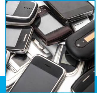
iPhones | Telephones | Cell Phones | Mobile Devices