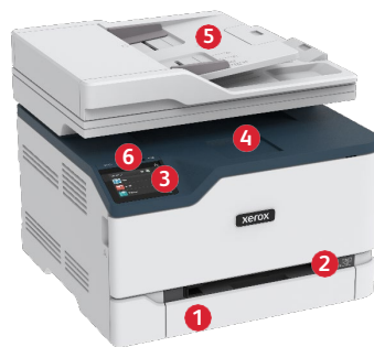
Xerox® C235 Multifunktions-Farbdrucker