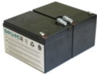
Abb. 2: BCZD1100