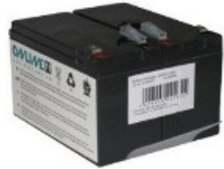
Abb. 1: BCZD800