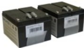
Abb. 3: BCZD1440