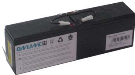
Abb. 2: BCZA800, BCZA1000