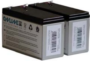
Abb. 1: BCYQ1250