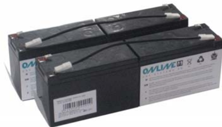
Abb. 3: BCZA1500, BCZA2000

Im Laufe der Zeit verringert sich die Leistung / Überbrückungszeit von Batterien, abhängig von Häufigkeit der Nutzung, Entladungsgrad und Umgebungstemperatur. Mit den montagefertigen Ersatzbatterien wird der Austausch zum Kinderspiel. Nur wenige Handgriffe genügen und die USV hat in Kürze wieder volle Überbrückungszeit. Die Hot-Swap-Funktion der ZINTO A-Serie ermöglicht den Batteriewechsel im laufenden Betrieb, auch ohne technischen Verstand: Batteriefach öffnen -> alte Batterie raus -> neue Batterie rein -> fertig!