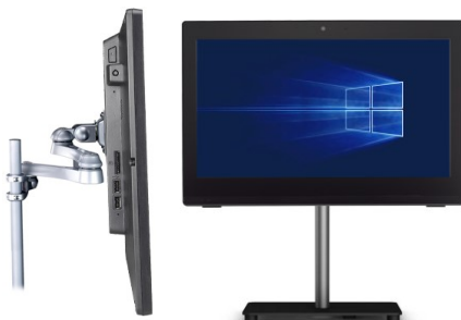
Bild rechts: Das Gerät lässt sich dann immer noch mit Hilfe einer aufgeklappten Büroklammer einschalten, die man durch ein unscheinbares Loch an der Geräteseite drückt.

Bild links: Der Einschalt-Button lässt sich deaktivieren, um unbefugtes Betätigen zu unterbinden. Hierzu öffnen Sie den PC und ziehen den entsprechenden Anschluss heraus (siehe Markierung).