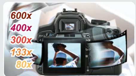
High-Speed Transferraten & verbesserte Kamerareaktion