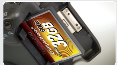
Extra-langlebiger Connector für häufiges Einlegen/Entfernen der Karte